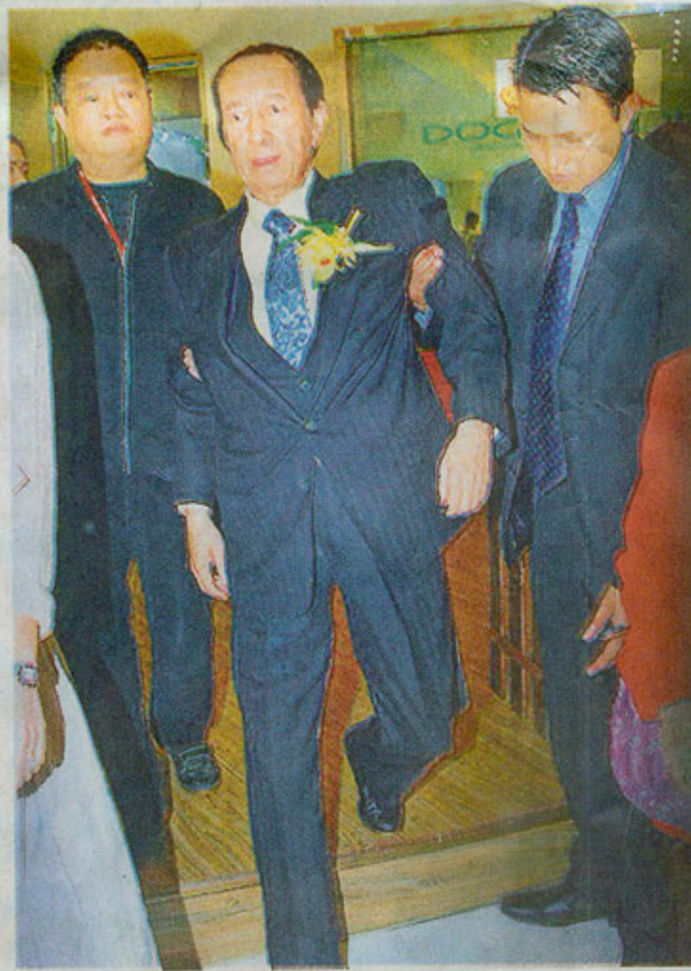
■何鴻燊(中) 87岁高龄脑受创昏迷，住了两多月医院仍未完全苏醒，希望靠高压舱恢复活动能力。

她忆述当时她在广州医院内目睹“一个个奇迹”出现：一名中煤气毒病者送院时奄奄一息，进入高压氧舱后苏醒；一名妇女产子后昏迷，医生已断定可能会变成植物人，接受高压氧几个月后已可步行出院。