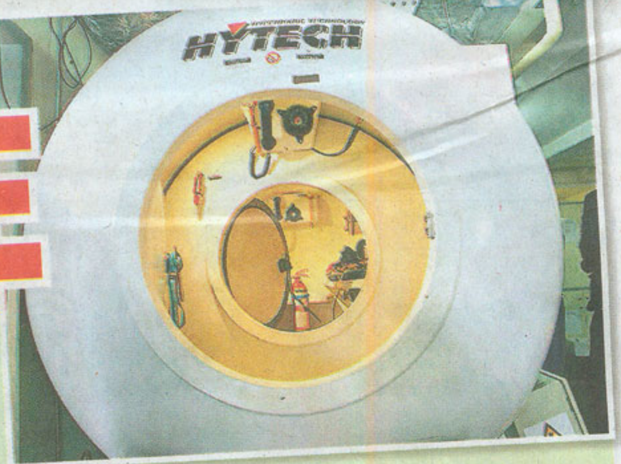
■位于昂船洲水警基地的高压氧舱，开放给政府医院病人使用。

气管开了一个气孔抽痰，最初入住港安深切治疗部时，更要靠机器呼吸，不过，赌王近日已能够自行呼吸，有医生于是建议做高压氧治疗，希望救醒赌王。